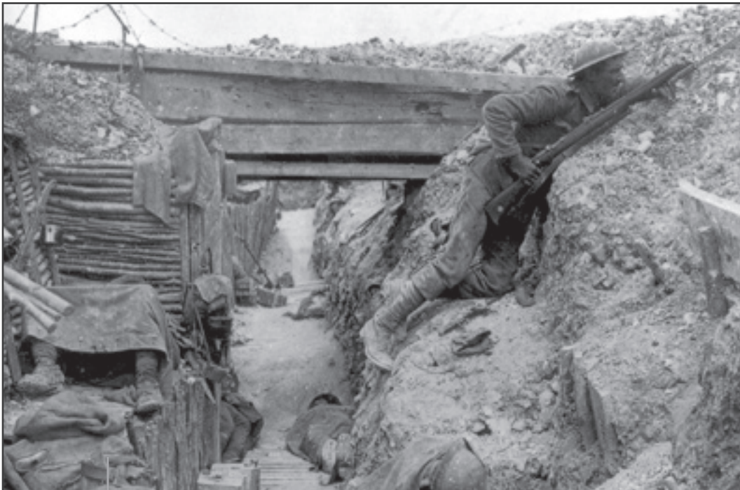
Soldats français, Verdun 1916